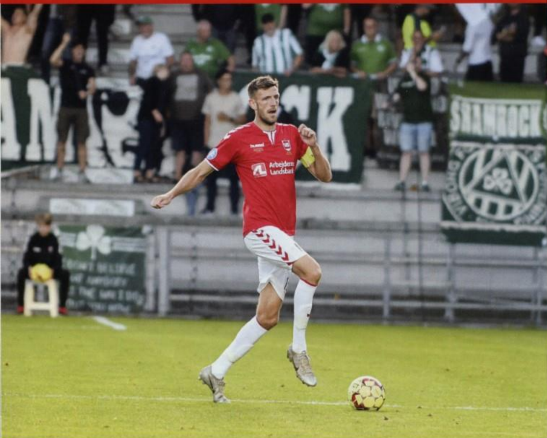
Greve fører bolden frem mod Viborg

gik fra at være et hold, der kæmpede for overlevelse i 1. division til at true de bedste hold i rækken og tale med om oprykning. Greve skiftede videre til VB i 2017, da vejlenserne købte den dengang 27-årige spiller fri, og efter én sæson rykkede han op i Superligaen med vejlenserne.