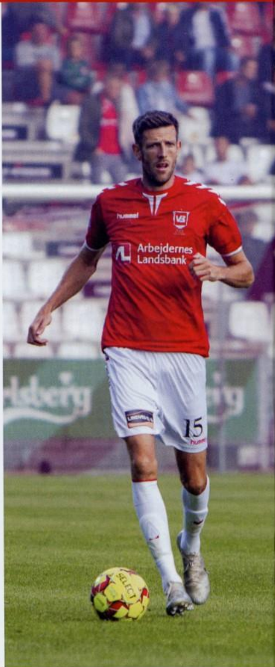
Greve på Vejle Stadion mod FC Fredericia i september